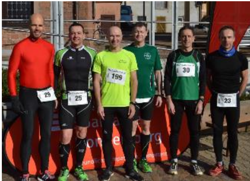
LCO Läufer beim Donnersberglauf

Pünktlich um 15 Uhr fiel am Samstag, den 27.02.2016, der Startschuss zum höchsten Berg der Pfalz (Höhe 686,5 m). 428 Läufer starteten vom Steinbacher Bürgerhaus aus, um 7,2 km und 418 Höhenmeter zu bewältigen. Gelaufen wurde auf der Straße ab Steinbach über Dannenfels, die Donnersberg-Höhenstrasse hinauf zum Ludwigsturm.