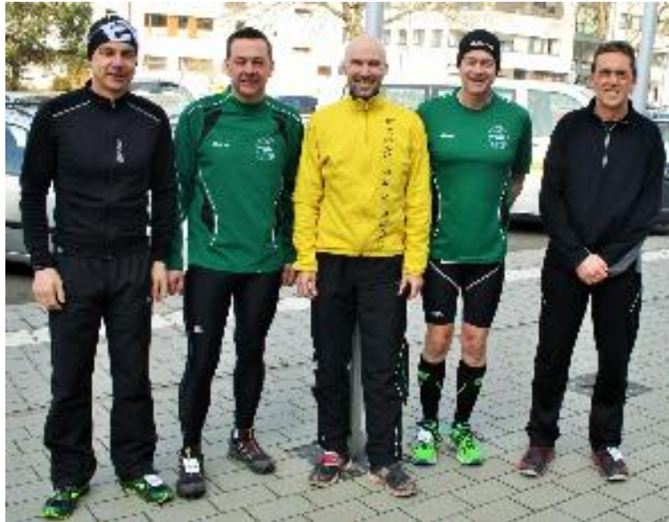
LCO Läufer beim Nanstein-Berglauf.

Beim 2. Berglauf am Samstag, dem 12. März, in Landstuhl waren 6 LCO-Läufer mit am Start. Für die Läufer ging es über 7,1km und 350Hm durch Wald und Pfade hinauf zur Burgruine Nanstein.