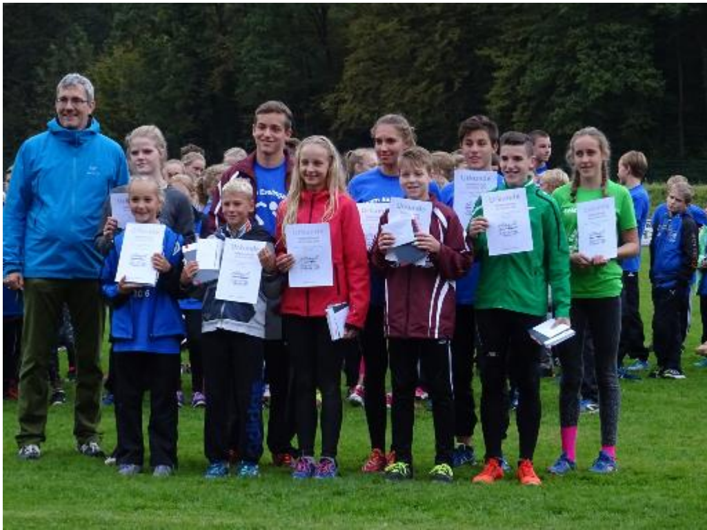
Die erfolgreichen LCO Athleten in Gaggenau.